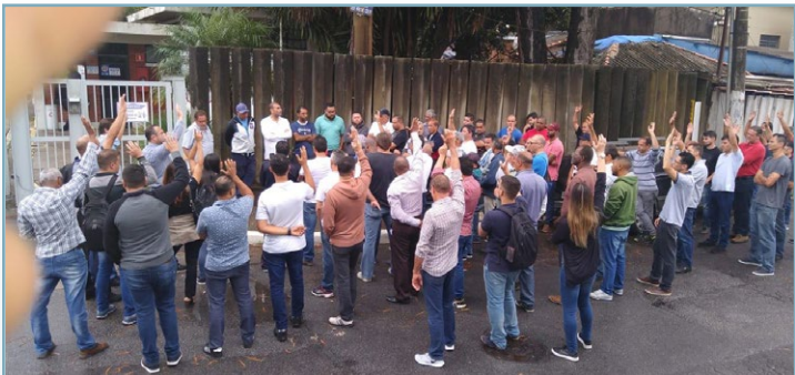
PTI Diretor Teco