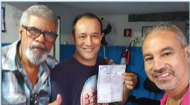
NOVALATA Diretor Bombeirinho