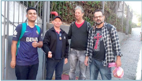
CPL MEDICAL Diretor Biro