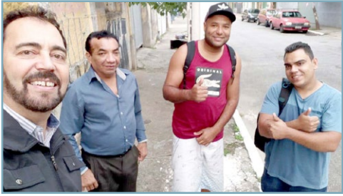
PARÂMETRO Diretor Ninja