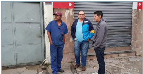
SINDAL Diretor Ceará