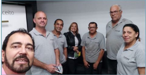
XILOTECNICA Diretor Ninja