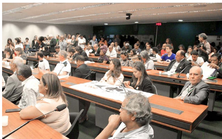
Reunião da Liderança da Minoria