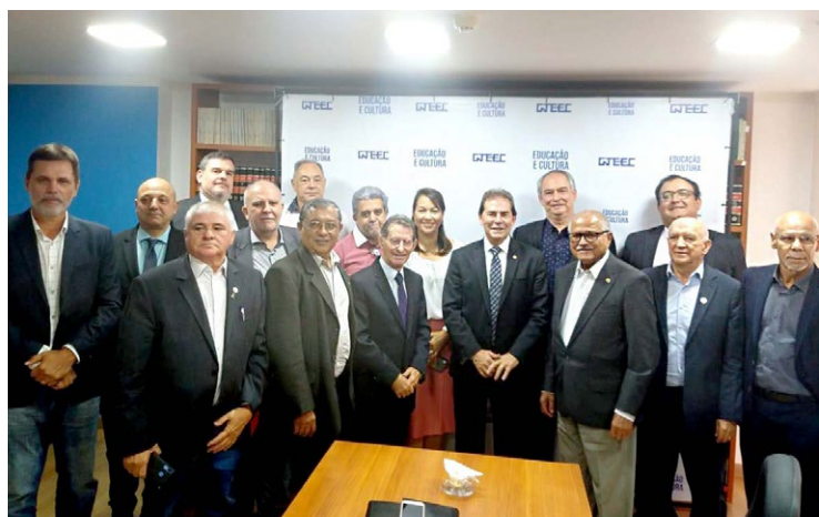
Reunião do Fórum Sindical dos Trabalhadores