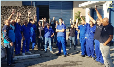
MUL-T-LOCK Diretor Ceará