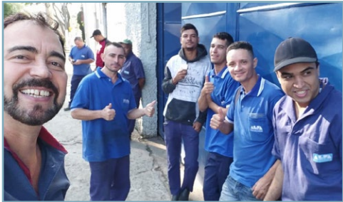
ALFA ELEVADORES Diretor Ninja