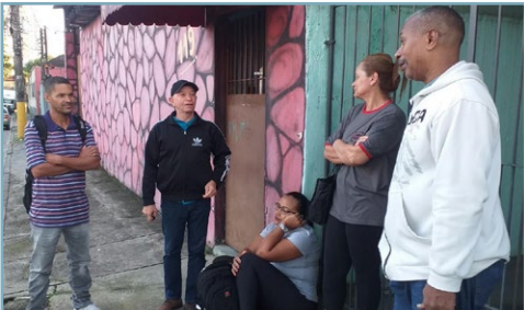
EDIPAR Diretor Biro