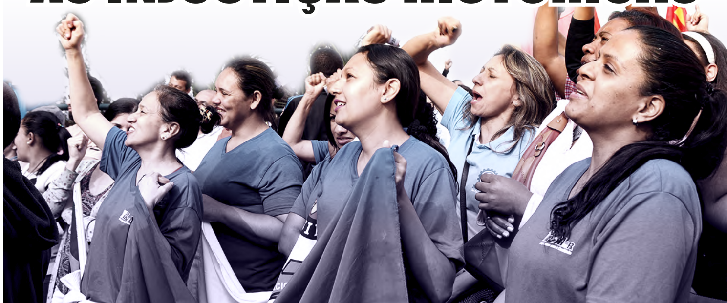
IMAGEM DE ARQUIVISTAS DA FAMBEM/IA

O Fórum das Mulheres Trabalhadoras das Centrais Sindicais destaca em recente manifesto que é de longa data a luta das mulheres na sociedade brasileira por igualdade de oportunidades e isonomia salarial e contra todas as formas de violência e de discriminação. Alguns fatos recentes: