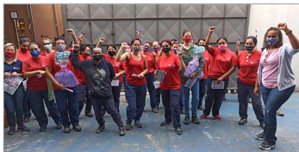
CAPARROZ - YARA