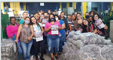
MOLPANK - ASSISTENTE DO CURIÓ