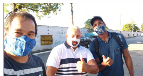
PTI - ASSISTENTES DO TECO