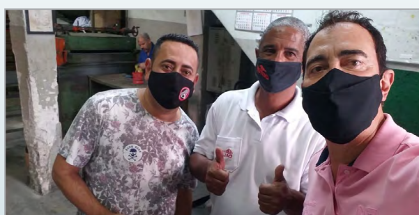
LAMINAÇÃO DALMET - NINJA