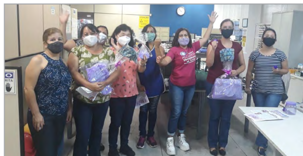
LYNX - SONETE