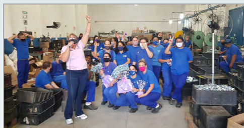
KMB - ASSISTENTE DO JESUS