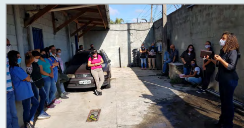
TECNOCON - ASSISTENTE DO ALEMÃO