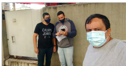
HB SOLUÇÕES - ASSISTENTES DO SALES