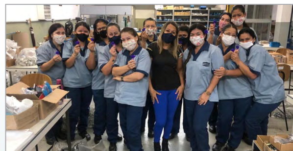
TURK - ALSIRA