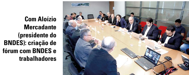
Com Aloizio Mercadante (presidente do BNDES): criação de fórum com BNDES e trabalhadores