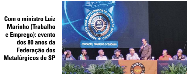
Com o ministro Luiz Marinho (Trabalho e Emprego): evento dos 80 anos da Federação dos Metalúrgicos de SP