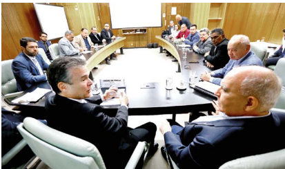
Com o ministro André de Paula (Pescaria): reunião com servidores públicos e pescadores