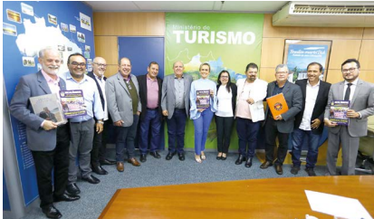
No Ministério do Turismo: parcerias para democratizar o turismo no Brasil