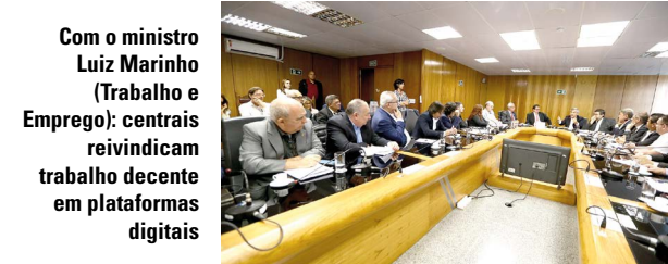
Com o ministro Luiz Marinho (Trabalho e Emprego): centrais reivindicam trabalho decente em plataformas digitais