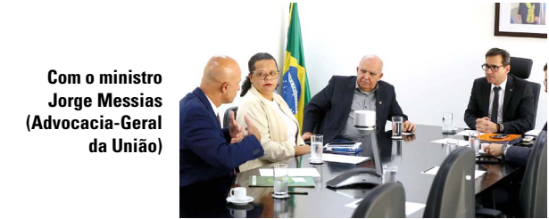
Com o ministro Jorge Messias (Advocacia-Geral da União)