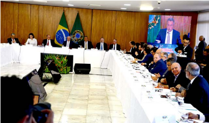
Com o presidente Lula e o vice Alckmin no Conselho Nacional de Desenvolvimento Industrial