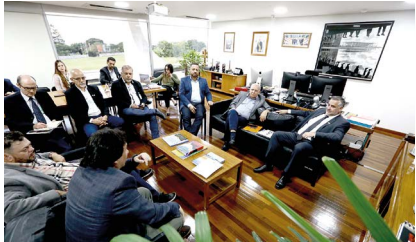
Com o ministro Paulo Pimenta (Comunicação Social): plano conjunto de ação comunicativa sobre as medidas sociais e populares do governo