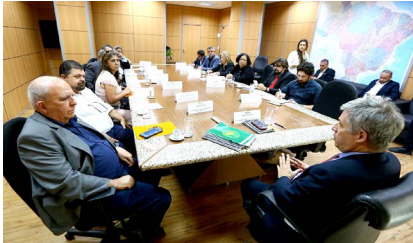
Com o ministro Paulo Teixeira (Desenvolvimento Agrário do Brasil): propostas da classe trabalhadora para a questão agrária