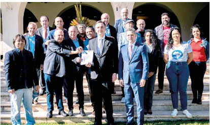
Com Rodrigo Pacheco, presidente do Senado: pedido de exoneração de Campos Neto do Banco Central