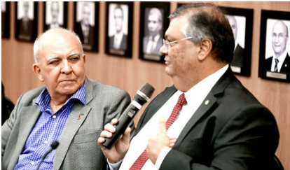
Com o ministro Flávio Dino (Justiça): Marco Regulatório das Relações de Trabalho no Setor Público