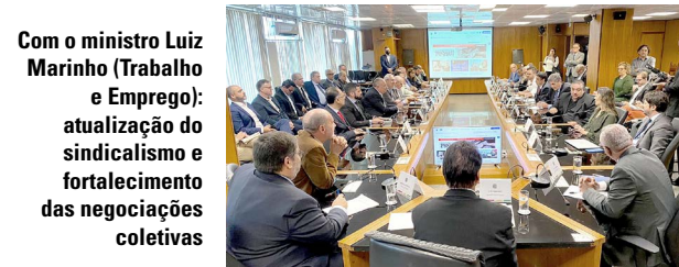
Com o ministro Luiz Marinho (Trabalho e Emprego): atualização do sindicalismo e fortalecimento das negociações coletivas