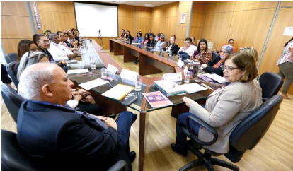
Com a ministra das Mulheres do Brasil, Cida Gonçalves