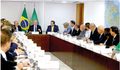
Com o presidente Lula, o vice Alckmin e o ministro Haddad: programa de fortalecimento da indústria nacional