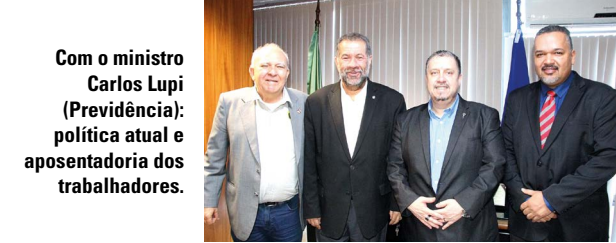
Com o ministro Carlos Lupi (Previdência): política atual e aposentadoria dos trabalhadores.