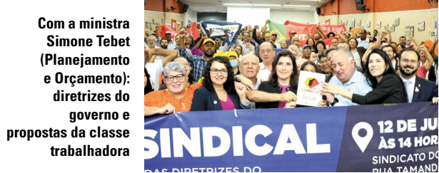
Com a ministra Simone Tebet (Planejamento e Orçamento): diretrizes do governo e propostas da classe trabalhadora