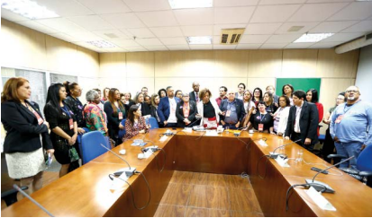
No ministério da Cultura, pasta da ministra Margareth Menezes