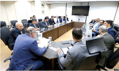
Com o vice-presidente e ministro Alckmin (Desenvolvimento, Indústria, Comércio e Serviços)