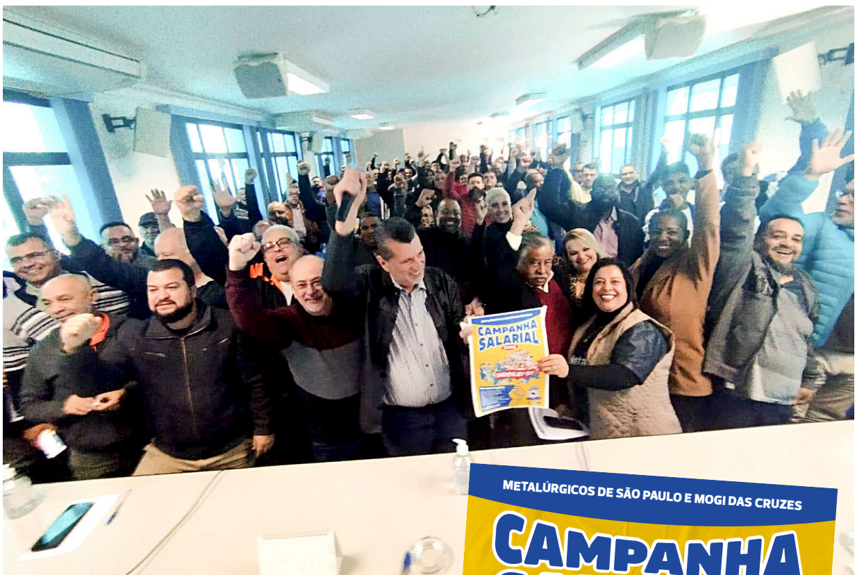
Assembleia realizada na sede da Federação, em São Paulo

A Assembleia Geral é um momento de participação e decisão coletiva sobre os interesses e as reivindicações da categoria!