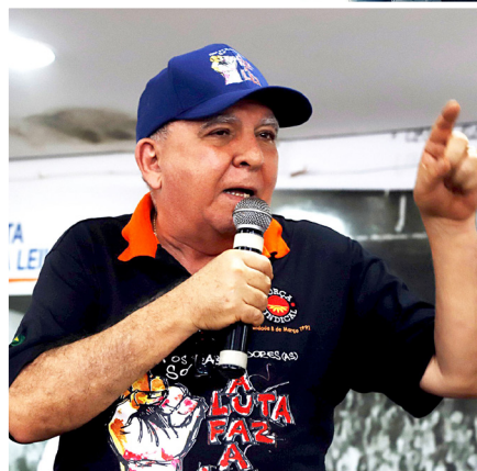
MIGUEL TORRES Presidente da Força Sindical, da CNTM e do Sindicato dos Metalúrgicos de São Paulo e Mogi das Cruzes

Mesmo sofrendo intensos ataques, o movimento sindical brasileiro não está derrotado e continua todos os dias com os