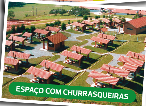
ESPAÇO COM CHURRASQUEIRAS