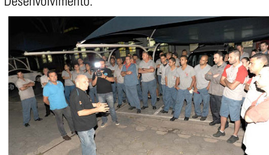
Assembleia com o 3º turno às 22 horas