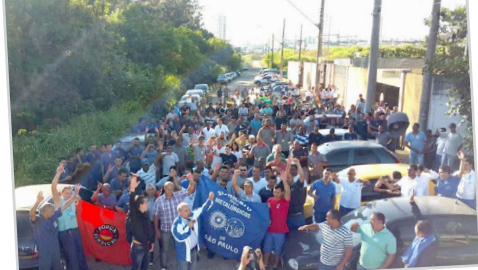
ENGESIG, TECNOCURVA, SERCON