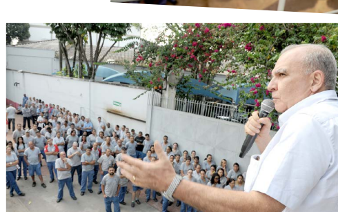
Assembleia com o 2º turno às 14 horas