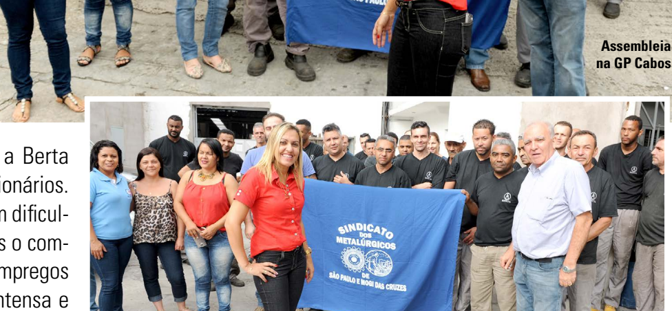
Assembleia na Berta

encaminhadas aos governos federal e estadual, são viáveis para a retomada do crescimento.