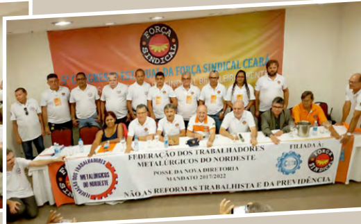
Posse da diretoria da Federação dos Metalúrgicos/CE