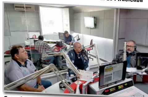
Entrevista à Rádio Difusora FM 102.3 de Piracicaba