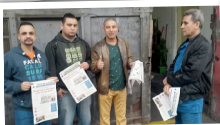
BRASFORMA (zona leste) Diretor Bombeirinho e equipe