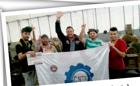
METALÚRGICA ROZ (zona leste) Equipe do diretor Jesus