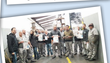
NEADE (zona sul) Diretor Ninja