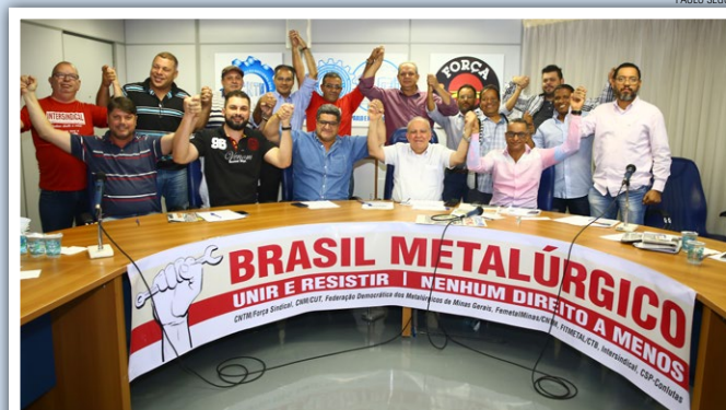
Dirigentes metalúrgicos do Brasil unidos na luta