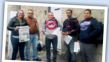
LOMBARD (zona oeste) Equipe do diretor Alemão