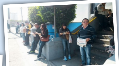
LORENZETTI HF (zona leste) Diretor Ninja e assessoria