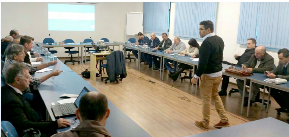
Apresentação da conjuntura econômica

“Precisamos ampliar a comunicação entre as entidades e focar na luta sindical. Não importa quem é o presidente da República, a gente vai lutar