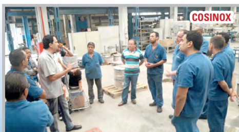
Diretor Ninja e equipe em assembleia de convocação para a assembleia na ALFA ELEVADORES e na COSINOX (zona leste)