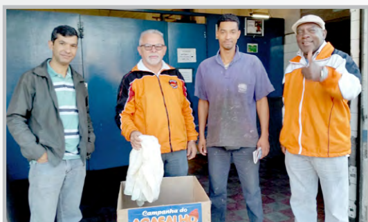
AFIGRAF (zona oeste) Equipe do diretor Ceará recolhendo agasalho.