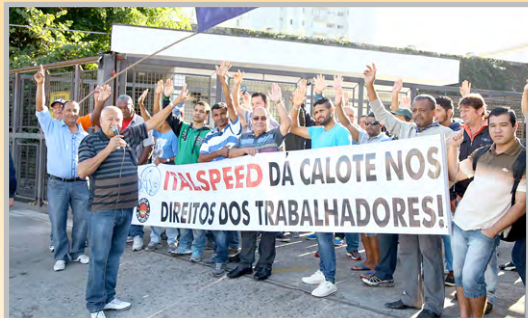
Ato na empresa