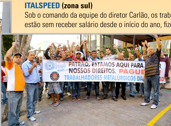
Ato na casa do patrão