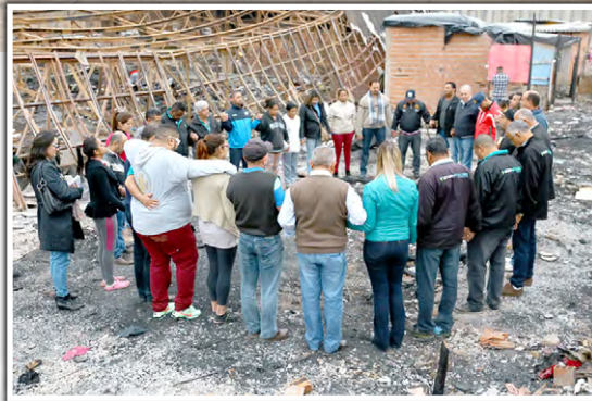
Momento de oração na área incendiada