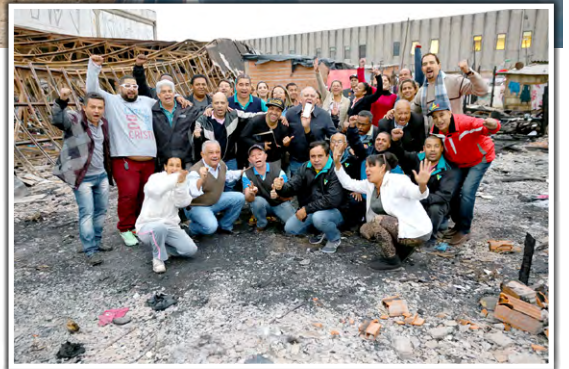
Dirigentes com coordenadoras da comunidade