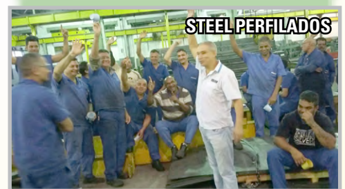
Diretor Bombeirinho e equipe com trabalhadores na STEEL PERFILADOS e da SUBRES (zona leste)