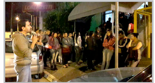
Diretor Ninja e equipe convocando trabalhadores da LORENZETTI (zona leste)