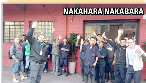
Trabalhadores da NAKAHARA NAKABARA e da RODOTEC aprovam assembleia antecipada com a equipe do diretor Sales