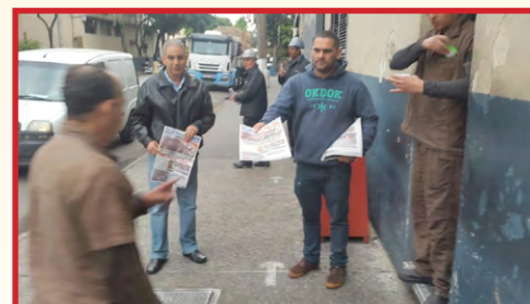
FERROLENE (zona leste) Diretor Bombeirinho convocando para a assembleia regional do dia 29 e distribuindo jornal do Sindicato aos trabalhadores