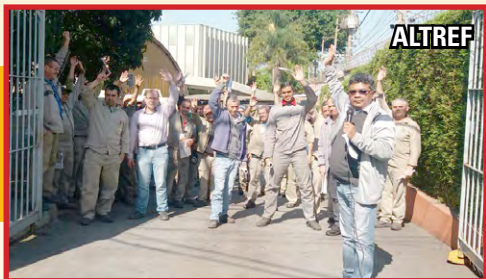
ALTREF e SAMOT (zona sul) Trabalhadores aprovam participação na assembleia regional dia 29, na Via Anchieta, com diretor Mala e equipe

O Sindicato começou a fazer assembleias regionais de mobilização para a Campanha Salarial e de preparação para o processo de negociação. E a diretoria e assessoria estão indo às fábricas informar e convocar os trabalhadores para a luta. As assembleias serão realizadas nas seguintes datas: nesta quinta-feira, 25/8 , na zona norte, em frente à Aliança; 29/8 , na Vila Liviero; 1/9 , na zona oeste, em frente à Alstom; 6/9 , em Mogi das Cruzes, na subsede.