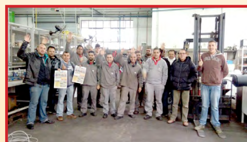
HB SOLUÇÕES (zona oeste) Equipe do diretor Sales mobilizando os trabalhadores para a assembleia do dia 1º de setembro em frente à Alstom e alertando sobre as propostas da CNI, que tiram direitos trabalhistas