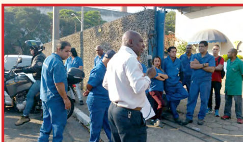
MUL-T-LOOK (zona oeste) Equipe do diretor Ceará convocando para a assembleia regional dia 1º de setembro, na Alstom