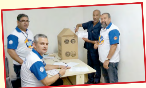
SINDAL (zona oeste) – setor do diretor Ceará