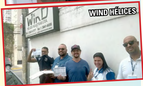
JOCLAU e WIND HÉLICES (zona oeste) setor do secretário-geral Arakém