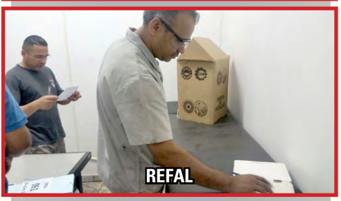
GUARDIAN e REFAL (zona oeste) – setor do diretor Alemão