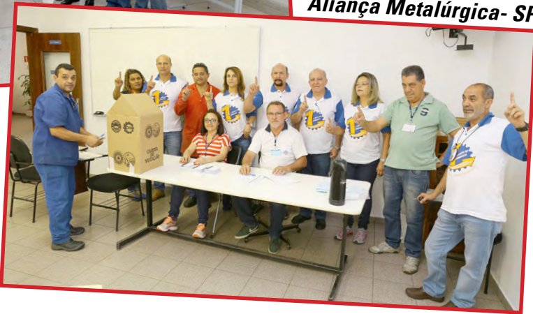
Aliança Metalúrgica- SP