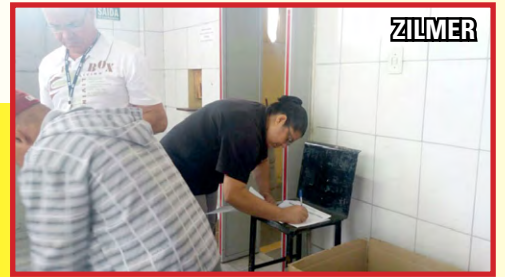
ALTREF, ENGEMET e ZILMER (zona sul) – setor do diretor Mala