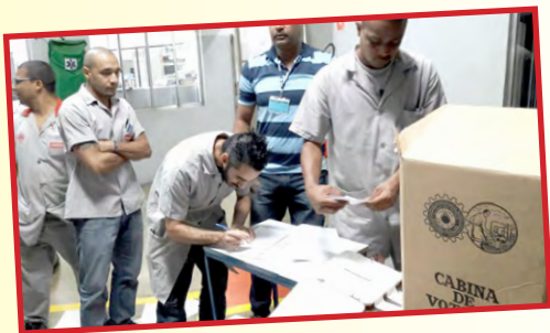
LORENZETTI (zona leste) – setor do diretor Ninja