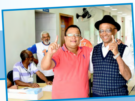
Aposentados votando na subsede em Mogi