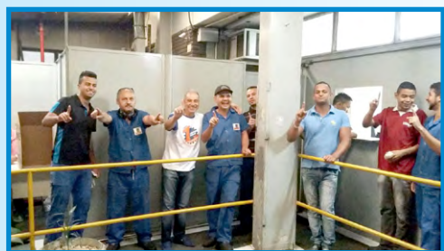
FERROLENE (zona leste) – setor diretor Bombeirinho