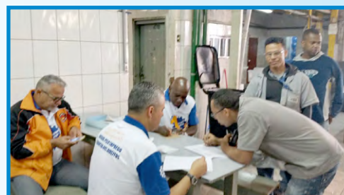
Votação em fábrica do setor do diretor Ceará (zona oeste)