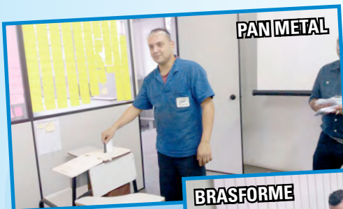
PAN METAL e BRASFORME (zona sul) – setor diretor Mala