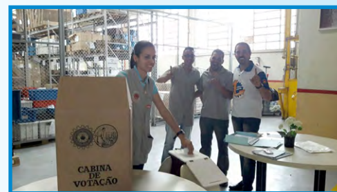
LORENZETTI (zona leste) – setor diretor Ninja