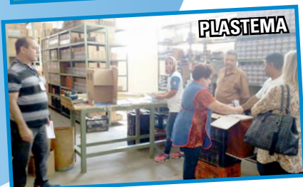
FRANZMAR, METALÚRGICA VERA, GARDINOTEC e PLASTEMA (zona leste) – setor diretor Nelson

A PARTICIPAÇÃO EXPRESSIVA DA CATEGORIA É FUNDAMENTAL PARA O FORTALECIMENTO DO SINDICATO.