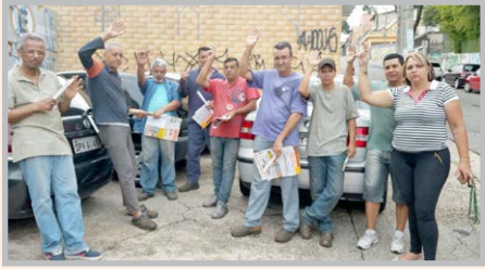
Equipe do diretor Alemão na EUROMAX (zona oeste)