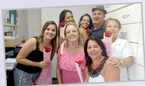
Diretor Xepa com funcionárias do CENTRO DE REFERÊNCIA EM ATENDIMENTO À SAÚDE DA FAMÍLIA METALÚRGICA (ambulatório Médico)