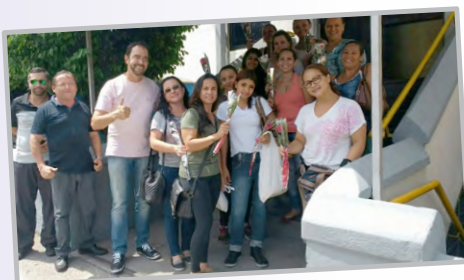
Diretor Ninja e equipe com trabalhadoras da LORENZETTI HF (zona leste)