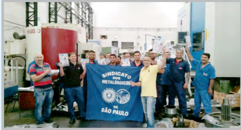
Diretor Mixirica e equipe na ALBERT ENGRENAGEM (zona leste)

Em assembleias nas fábricas, os trabalhadores estão reprovando as propostas das reformas previdenciária e trabalhista do governo e aprovando as assembleias regionais convocadas pelo Sindicato em defesa dos direitos. Eles dizem NÃO à idade mínima de 65 anos para aposentadoria, ao aumento do tempo de contribuição para 25 anos, à mudança no cálculo dos benefícios, à desvinculação dos benefícios assistenciais do salário mínimo, à redução das pensões, à terceirização, ao negociado sobre o legislado, à jornada de trabalho flexível, entre outras. A primeira assembleia regional foi realizada na zona leste. A próxima será dia 15 - Dia Nacional de Luta e Mobilização - na Ponte do Socorro, na zona sul!