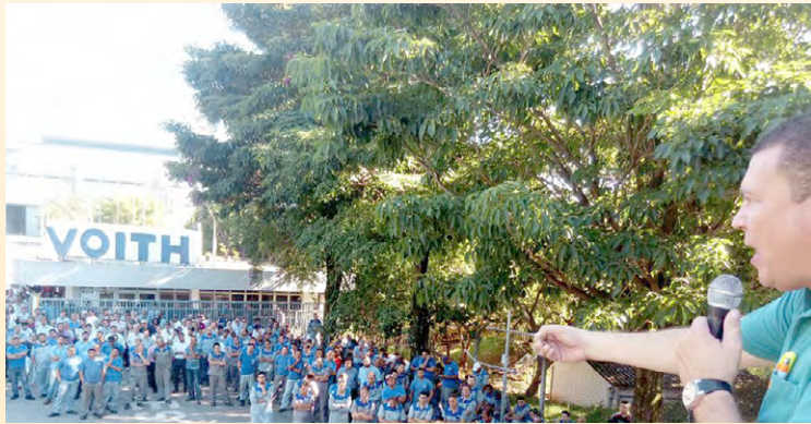
Diretor Sales e equipe na Voith