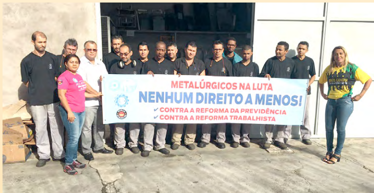
Diretor Alsira e equipe na Berta