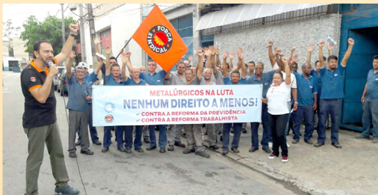
Diretor Ninja e equipe com trabalhadores de várias empresas