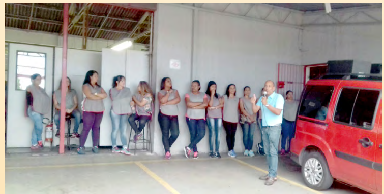
Diretor Maloca e equipe na Amplicabos

# MÃO NA MÃO PUNHO CERRADO TRABALHADOR UNIDO JAMAIS SERÁ VENCIDO! Orgulho de ser Metalúrgico!