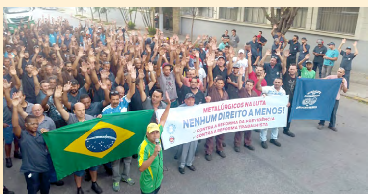
Diretor Bombeirinho e equipe na Aratell e Ferrolene