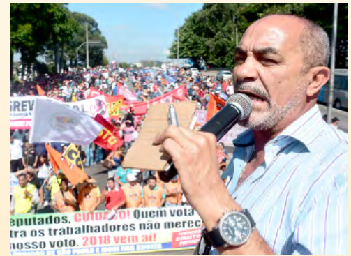
Secretário-geral Arakém à frente do protesto na região