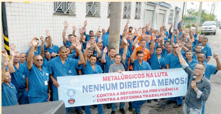
Diretor Mixirica e equipe na Ventisilva