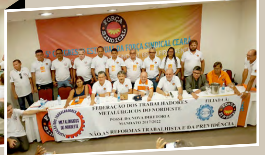
Posse da diretoria da Federação dos Metalúrgicos/CE