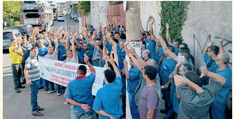
Diretor Alemão e equipe na Combustol Metalpó