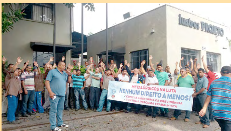
Diretor Mala e equipe e coordenador Mazuti na Lustres Projeto