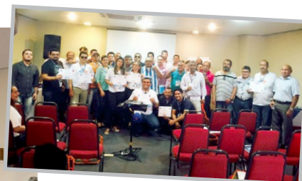
Curso de Formação da CNTM