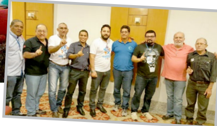
Encontro com dirigentes da Força Pará