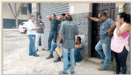
Convocação para a greve na SERRALHARIA MARCONE (zona leste) com a equipe do diretor Ninja