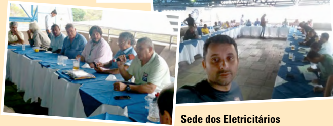
Sede dos Eletricitários