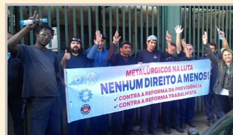
Equipe do diretor Alemão falando sobre as reformas na FELCHER (zona oeste)