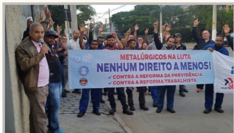
Diretor Bombeirinho e equipe na LANDO (zona leste)