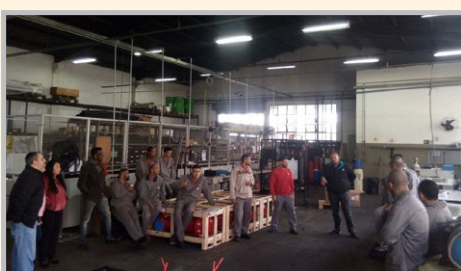
Equipe do diretor Sales na HB SOLUÇÕES (zona oeste) discutindo sobre PLR 2017 e a paralisação contra as reformas