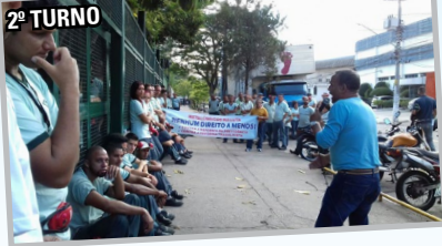
Diretor Maloca e equipe comandaram assembleias com os dois turnos da BRASILATA