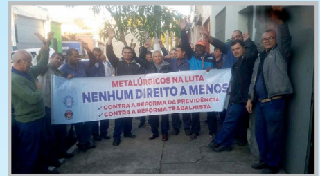
Equipe do diretor Ceará em assembleia na SINDAL