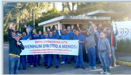
Assembleia de convocação na PTI com a equipe do diretor Teco