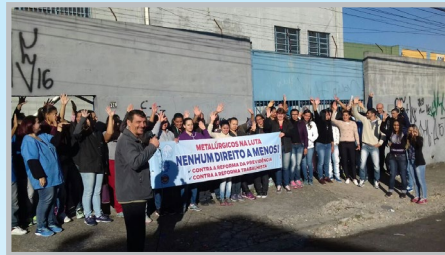
Mobilização na TECNOCON com o diretor Alemão e equipe