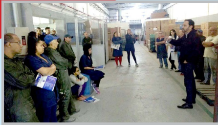
Assembleia na FOX PINTURAS com diretor Ninja e equipe