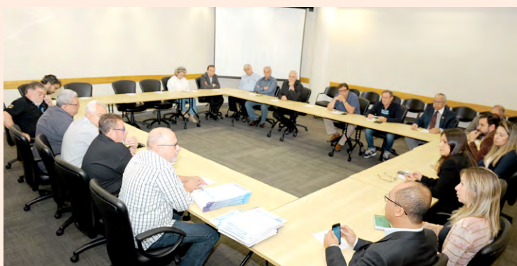
A mesa reuniu representantes de todos os grupos patronais na sede da Fiesp

Hoje, o Comando de Negociação dos metalúrgicos entregou a Pauta de Reivindicações da categoria ao grupo patronal 10 (Fiesp) e aos representantes de outros nove grupos, entre eles, Sicetel, Siniem e Fundição.