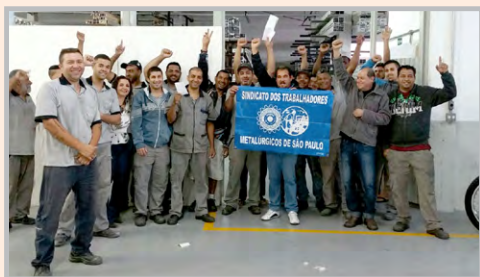
Equipe do diretor Teco na ESQUADRIMAX