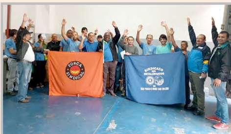
Diretor Ceará e equipe mobilizando os trabalhadores da GOLDEN KRAFT (setor do Lourival)