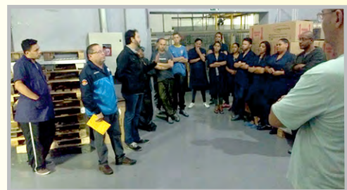
FOX PINTURA (zona sul) – Diretor Ninja conversando com os trabalhadores sobre o desconto assistencial aprovado na campanha salarial