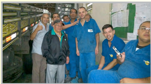
Diretor Bombeirinho e equipe na CALHA FORTE (zona leste)