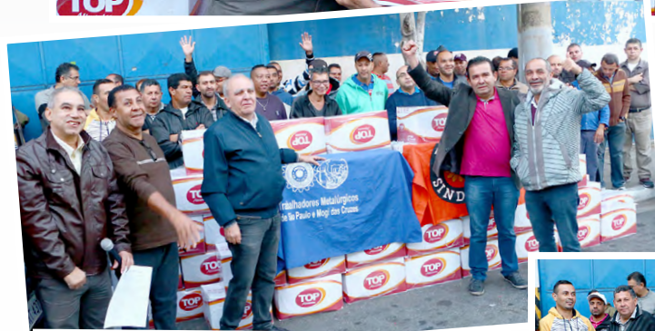
Unidade na luta