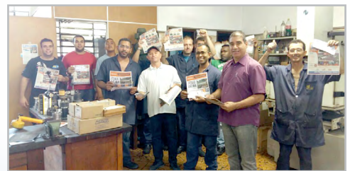
BUTTNER (zona sul)

A equipe do diretor Lourival garantiu o pagamento da 2ª parcela da PLR no dia 29 de abril e o retorno do convênio médico para os trabalhadores da Kap (Várzea de Baixo, região sul).