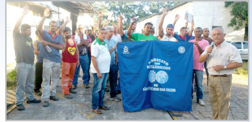
PROMOVE (zona leste)