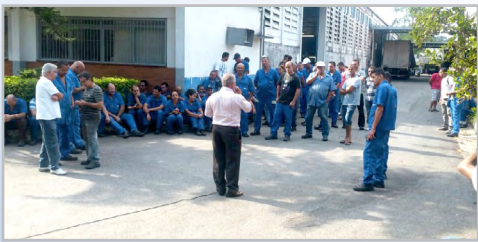
TECKNIA (zona leste)