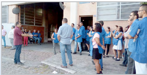
KAP (zona sul)