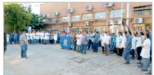
LUMINI (zona sul)

A equipe do diretor Curió conquistou a PLR para os trabalhadores desta empresa de usinagem localizada no Parque Novo Mundo (região norte). O benefício será pago em parcela única em dezembro deste ano.