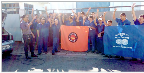
TECNOFLEX (zona sul)