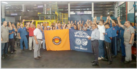
ALLI (zona leste)