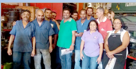
TRITEC (zona sul)