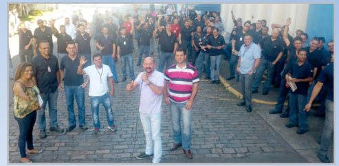
KHS (zona norte)