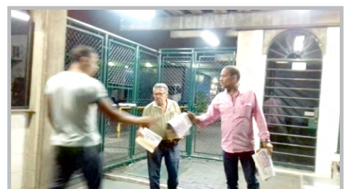
Diretor Maloca e equipe na BRASILATA (zona norte)

MÃO NA MÃO PUNHO CERRADO TRABALHADOR UNIDO JAMAIS SERÁ VENCIDO!