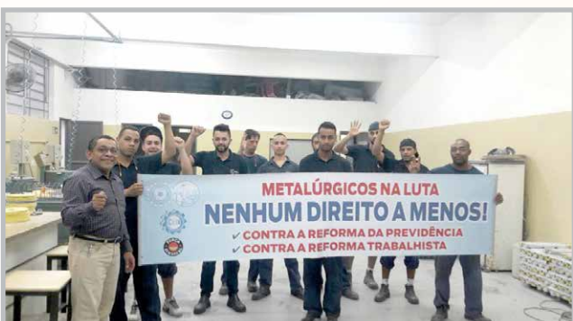
Trabalhadores da GILPELL M.P (zona leste) aprovam as manifestações e greves do movimento sindical contra as reformas – Equipe do diretor Néelson