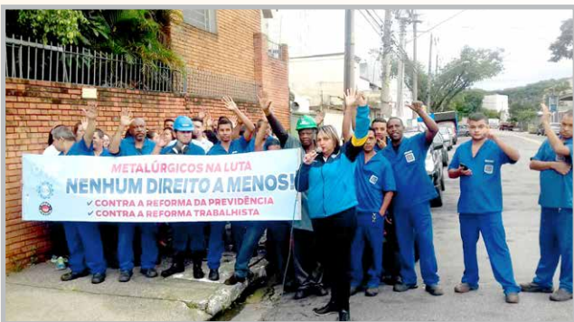
Equipe do diretor Alemão na GP ISOLAMENTOS (zona oeste) falando sobre as reformas e a importância da organização e da unidade na luta