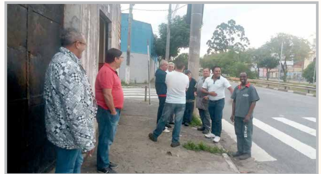
Diretor Curió e equipe conversando com trabalhadores da SERRAS SATURNO (zona norte)