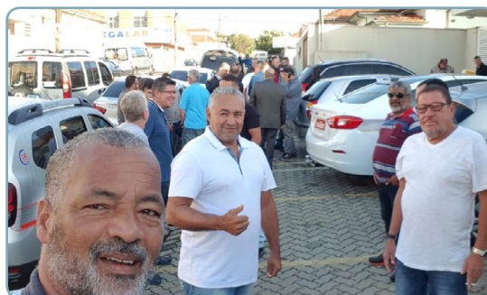
ELEIÇÕES METALÚRGICAS EM BOTUCATU Teco e equipes