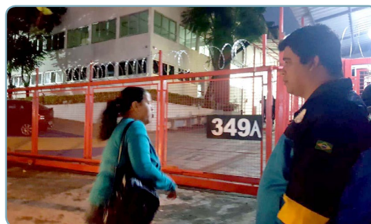
AMPLICABOS Equipe Érlon