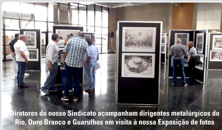
Diretores do nosso Sindicato acompanham dirigentes metalúrgicos do Rio, Ouro Branco e Guarulhos em visita à nossa Exposição de fotos

Não perca! Prestígie a história da classe trabalhadora e a cultura!