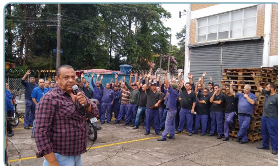
DRIVEWAY Mala e equipe