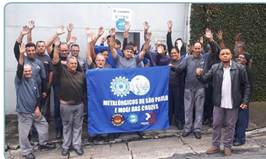
CARBOMEK Equipe Chico Pança