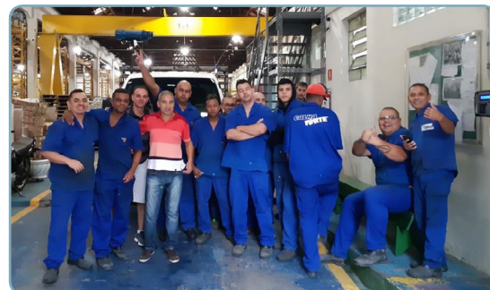
CALHA FORTE Bombeirinho e equipe