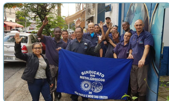
CROMAÇÃO UNIVERSO Sonete e equipe