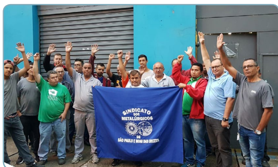
CARDAL Ceará e equipe